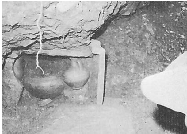
Fig. 1. Tomba n. 26, a incinerazione (da: Sopra alcuni ritrovamenti tombali di età romana a Lovere 1973, p. 35).